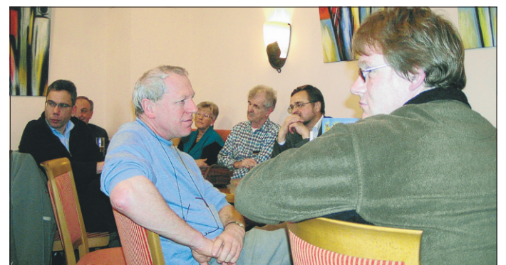
Über das Wachstumsbeschleunigungsgesetz und dessen Folgen für die städtischen Haushaltskassen wurde beim Dreikönigshock des SPD-Ortsvereins diskutiert.

müsse indes darauf achten, dass die Streichungen im Haushalt nicht zu Lasten der